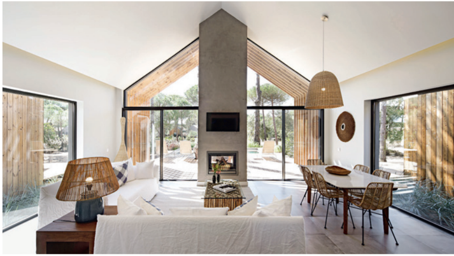
Ci-contre : pin pétrifié finlandais, acier oxydé, béton brut ou ciré, tels sont les ingrédients de cette architecture de plage revisitée et habillée de mobilier Gervasoni, luminaires en paille, plaids danois... Soit un petit air scandinave. Ci-dessous : le spa s'agrandit cet hiver.