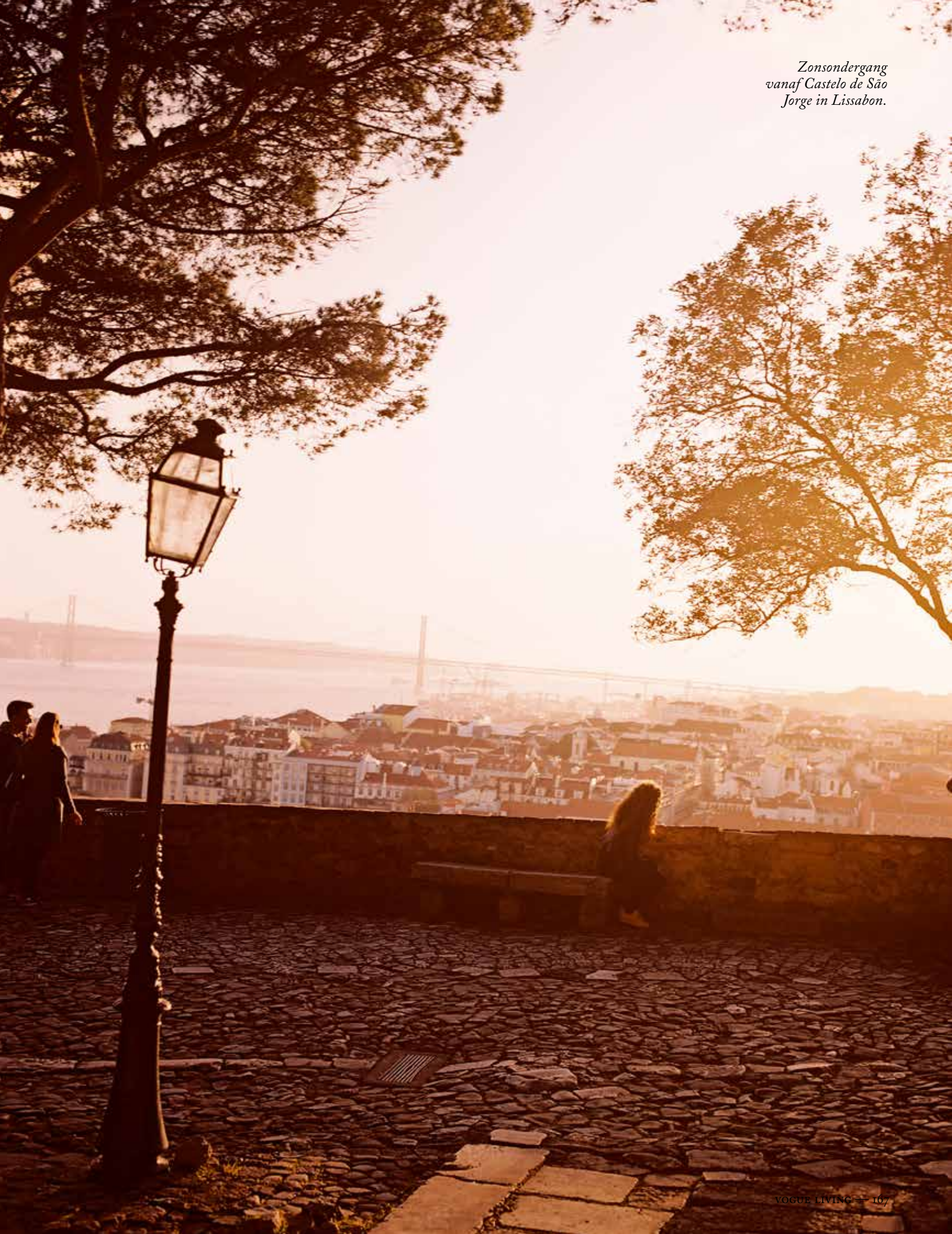
Zonsondergang vanaf Castelo de São Jorge in Lissabon.