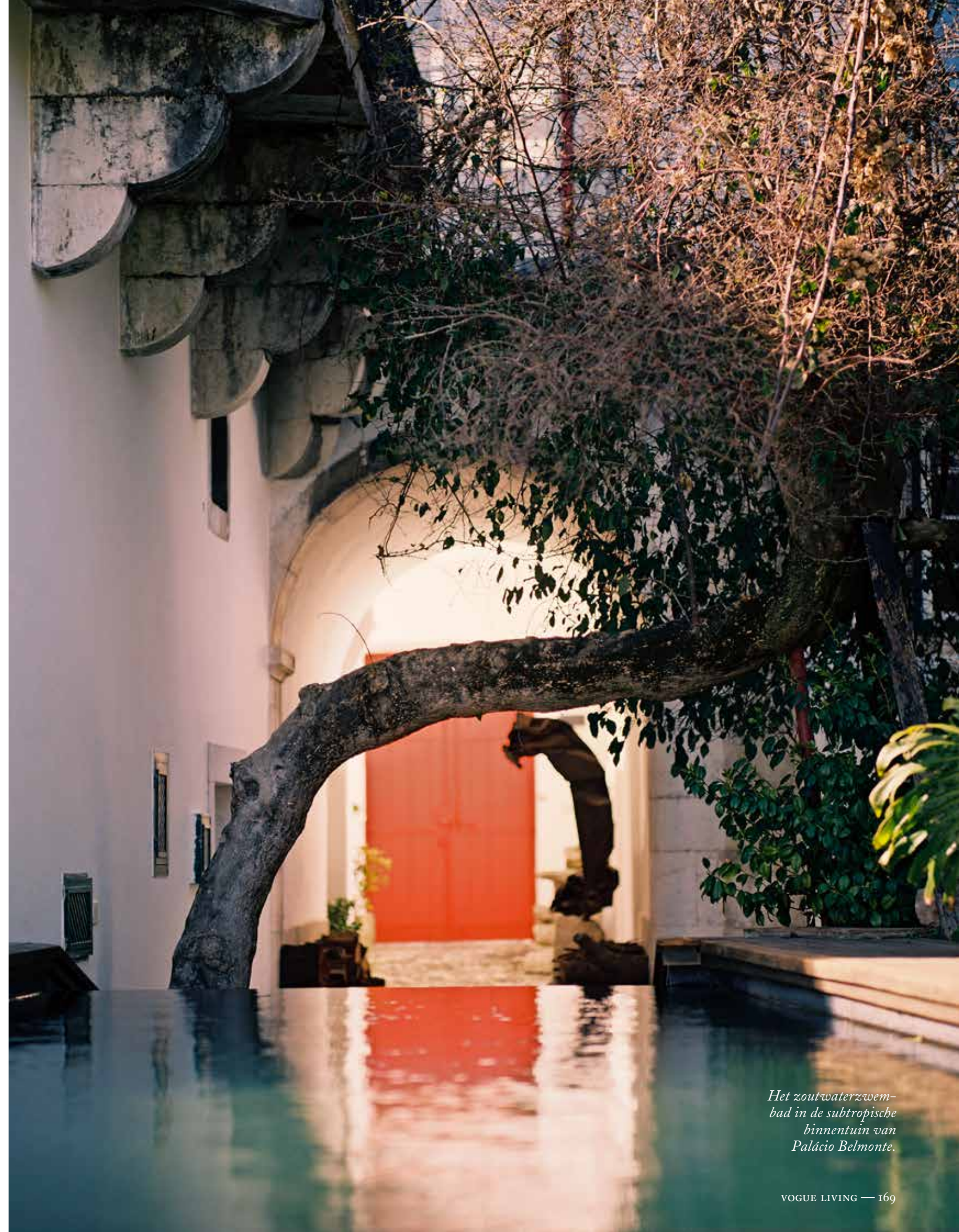
Het zoutwaterzwembad in de subtropische binnentuin van Palácio Belmonte.

Palácio Belmonte wordt terecht genoemd in allerlei lijstjes met beste hotels ter wereld. In het koffietafelboek Chic Stays van uitgeverij Assouline noemt Jeremy Irons het zijn tweede thuis en Louboutin reist pas door naar zijn vissershut in Comporta nadat hij een baantje heeft getrokken in het zoutwaterzwembad in de tuin. De magie? Misschien helpt het dat Palácio Belmonte geen hotel is en Coustols geen hotelier. Dit een guest palace waar een kind van zeventig de scepter zwaait. Met steevast een boek onder zijn arm dwaalt hij door zijn eigen labyrint. Coustols is een man van verhalen. Als geen ander weet hij dat het verhalen zijn die de verbeelding in werking zetten. Onontbeerlijk voor een dromer. Frederic: ‘Als klein jongetje sliep →