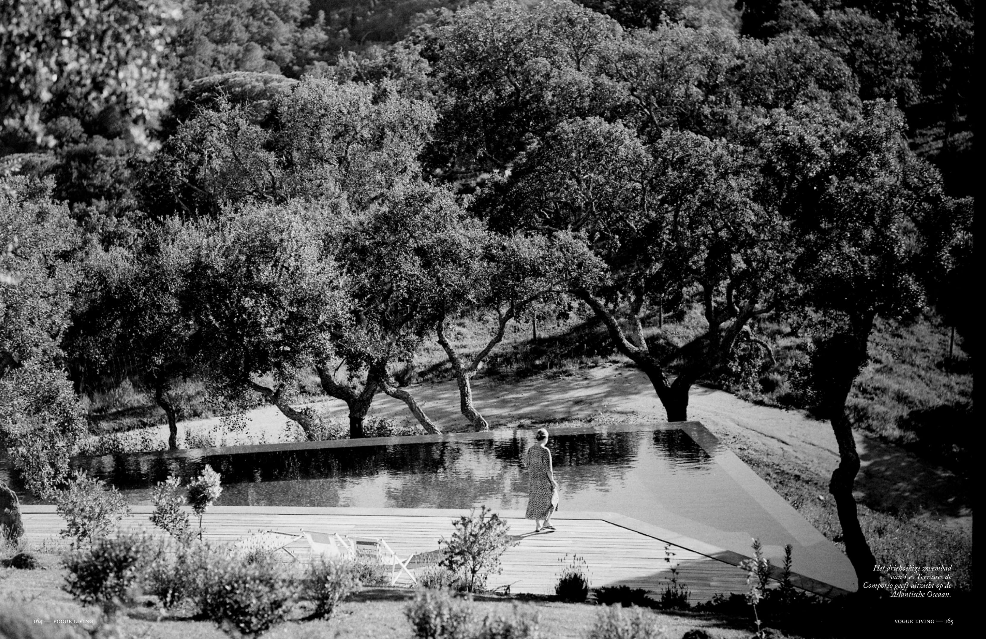
Het drieboekige zwembad van Les Terrasses de Comporto geeft uitzicht op de Atlantische Oceaan.