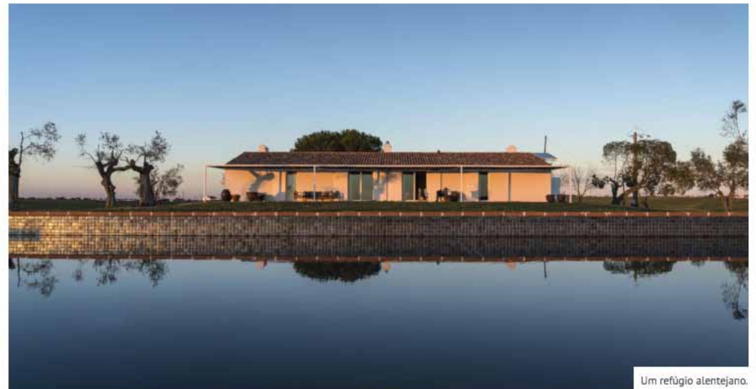
Um refúgio alentejano.