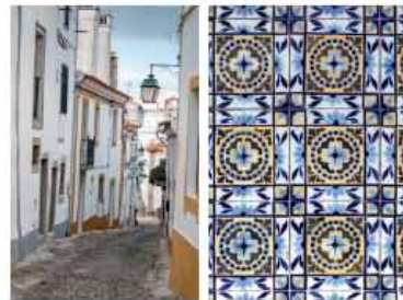
Montemor – –Novo está cheia de casas tradicionais portuadas de fachadas de azulejos coloridos

uma refeição substancial. Afinal, trata-se de retemperar forças, quem nunca disse para si, «Eu bem que mereço isto»? Pois bem, aqui fica a legitimação: 13 quilómetros a pedalar pode não ser propriamente uma odisséia, mas dá plena justificação para se fazer o ligo desvio até Escoural e tomar mesa na sala de Manuel Aznhetrinha. Convém reservar, já agora, que os lugares não são muitos, ao contrário da fama que a casa acumulou ao longo dos seus 25 anos de vida. O segredo não tem se-