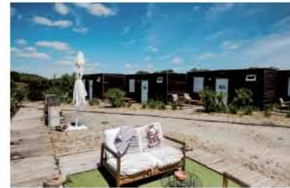
Burriscas é um parque de camping rural, composto por bungalows despretensiosos, que são um convite para o contacto com a natureza